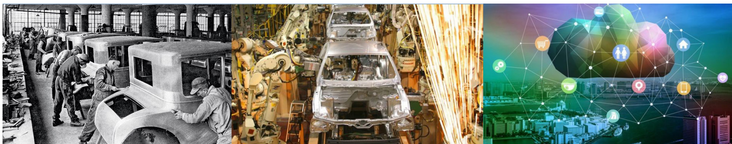
1. Interior de uma fábrica nos EUA em 1920.