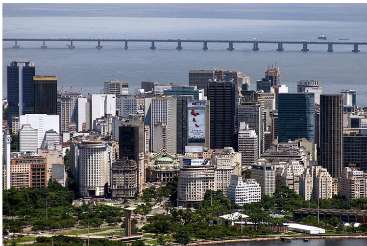
Centro da cidade do Rio de Janeiro, 2016

B avalie as principais consequências socioeconômicas e culturais da revitalização da zona periférica da área central do Rio, compreendida pela Região Portuária e pela Cidade Nova.