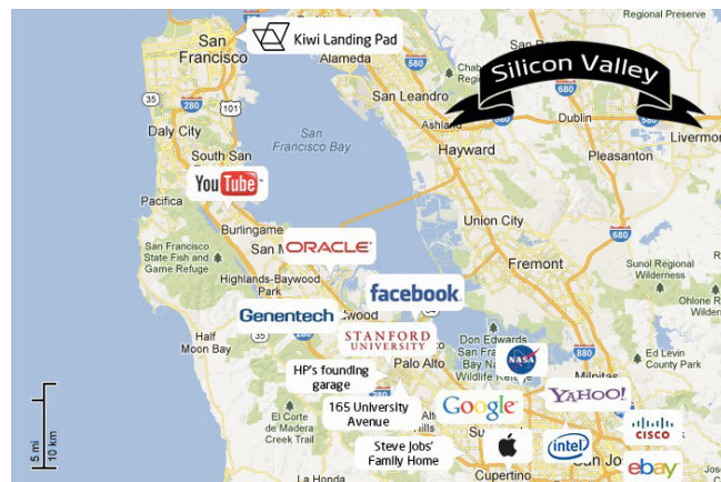
Mapa do Vale do Silício (Califórnia, EUA).

Adaptado de FACHE, J. As mutações industriais . Paris: Ed. Berlin, 2008.